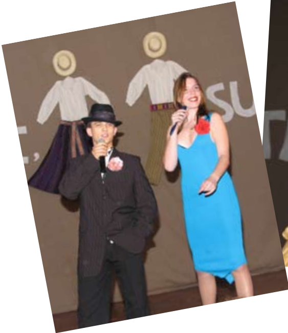
“Ei, studente, sukis vėju!”