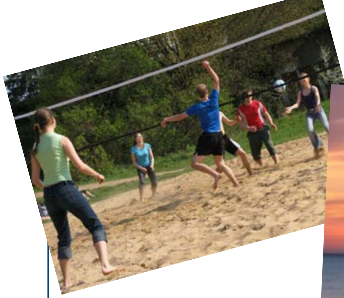
Tinklinio kovos Panemunėje