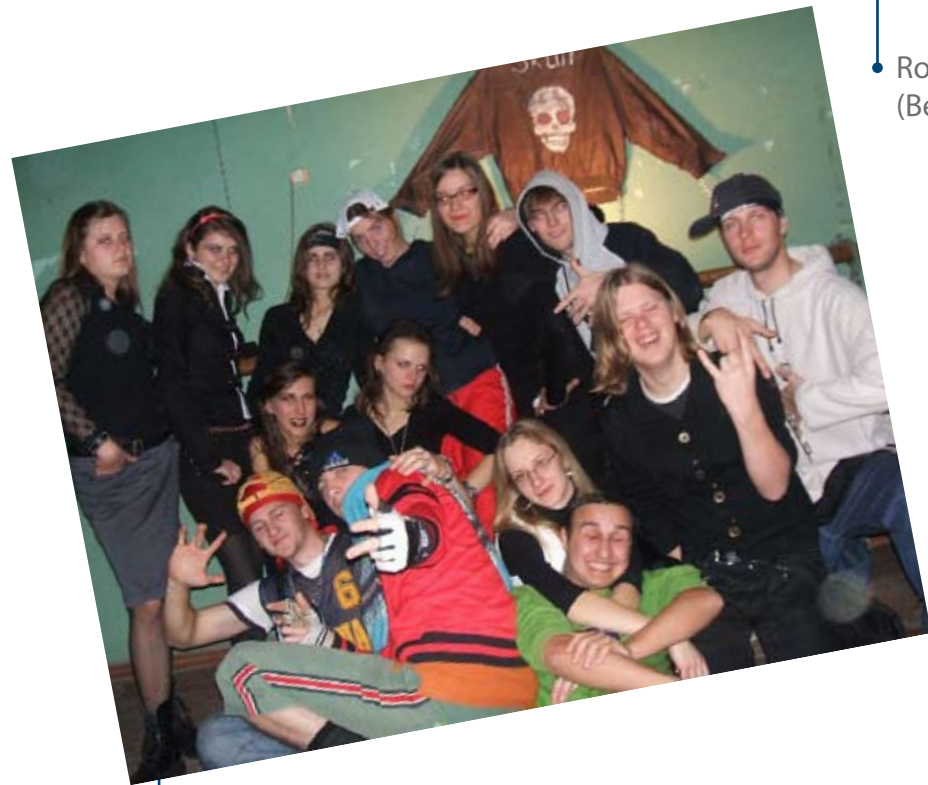
Vokalų cementukas 2007

„Niamuno sootraukos“ Lapkričio 21 d. //2008